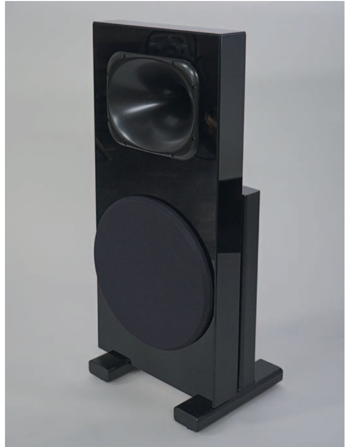
Das vollaktive Flaggschiff von Spatial: Die X1 mit stattlichem Bass in 18 Zoll plus Vier-Zoll-Hochtonhorn.

Zum Finale wartet MachOne noch mit einer Überraschung auf: Der kleine Verstärker Bantam One wurde von Temple Audio in Manchester erdacht und hergestellt und voll digital aufgebaut.