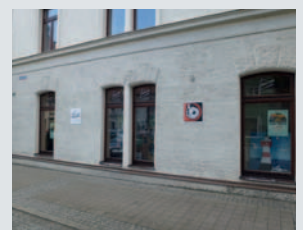
Das Ladengeschäft in Ingolstadt.

ausgewählte Produktpalette für die Kunden zusammengestellt, stetig verfeinert und behutsam ergänzt. Die aus diesen intensiven Hörerfahrungen entstandenen Netzwerke zwischen Herstellern, Kunden und der